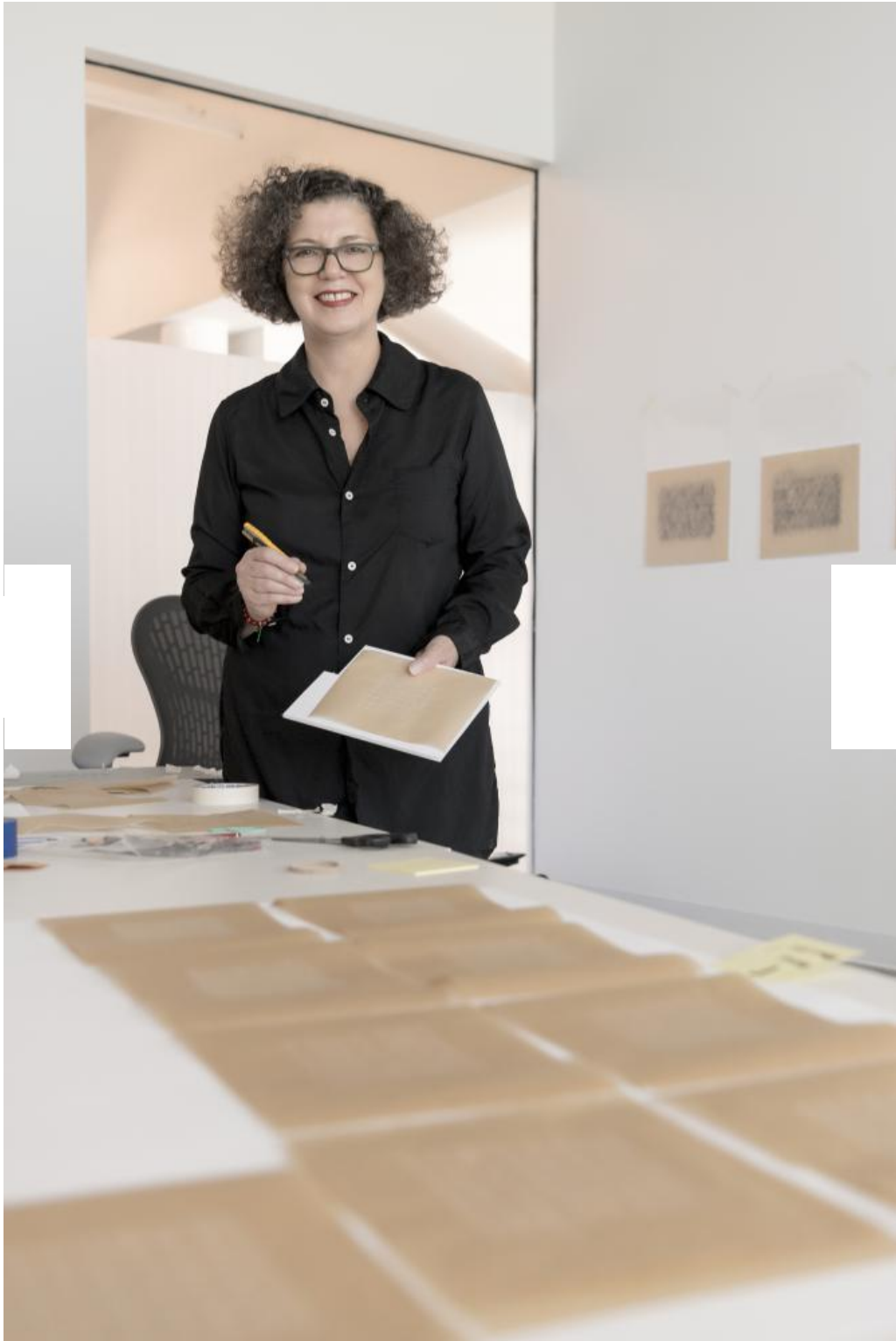
Mona Hatoum, 2017