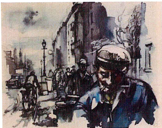
1958 – Der Morgen