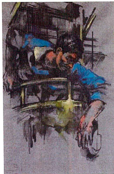
1967 – Kranführer

Arbeiten ist die ausdrucksbetonte, teils expressive Farbigkeit sowie Farbflächen und Formen, die bis ins Abstrakte gehen. Obwohl sich der umgebende Raum dabei zuweilen auflöst, wirkt der Mensch dabei nie verloren, sondern lebendig und würdevoll.