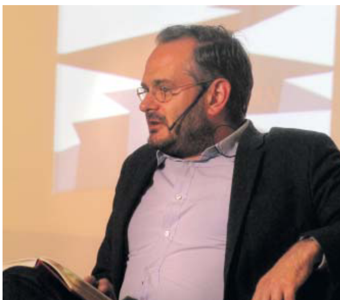
Stellte seinen Roman „Kraft“ vor: Jonas Lüscher bei seiner Lesung in der Stadtbibliothek.